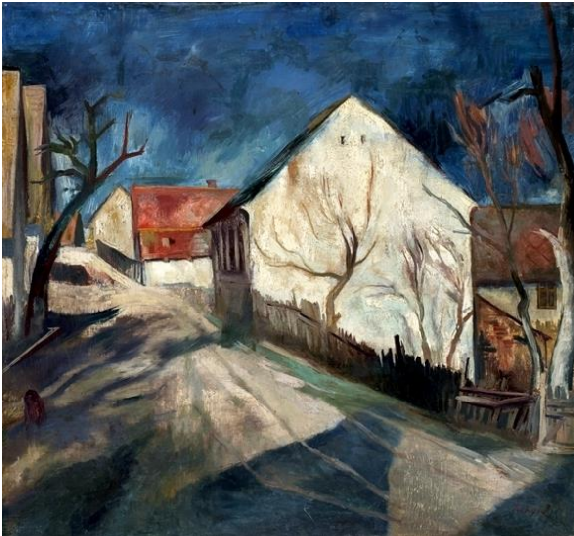
Zebegényi utcarészlet, 1930 körül

A gyerekek virágcsokrokkal kedveskedtek neki, ő pedig botanikára, idegen nyelvekre, a természet szeretetére és sportokra taníttatta őket. Számos örök élményt adó programot szervezett számukra, színelőadásokat, sportversenyeket, 1934-ben pedig a Virágolimpiát, ahova a legelőkelőbb hazai és külföldi személyek is ellátogattak. A ma már 80-90 éves egykori zebegényi gyerekek szeretettel őrzik az emlékét.