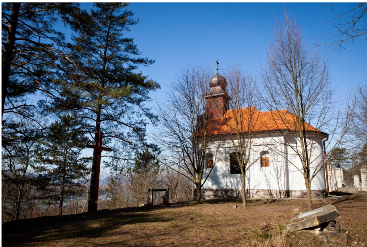
A kápolna ma