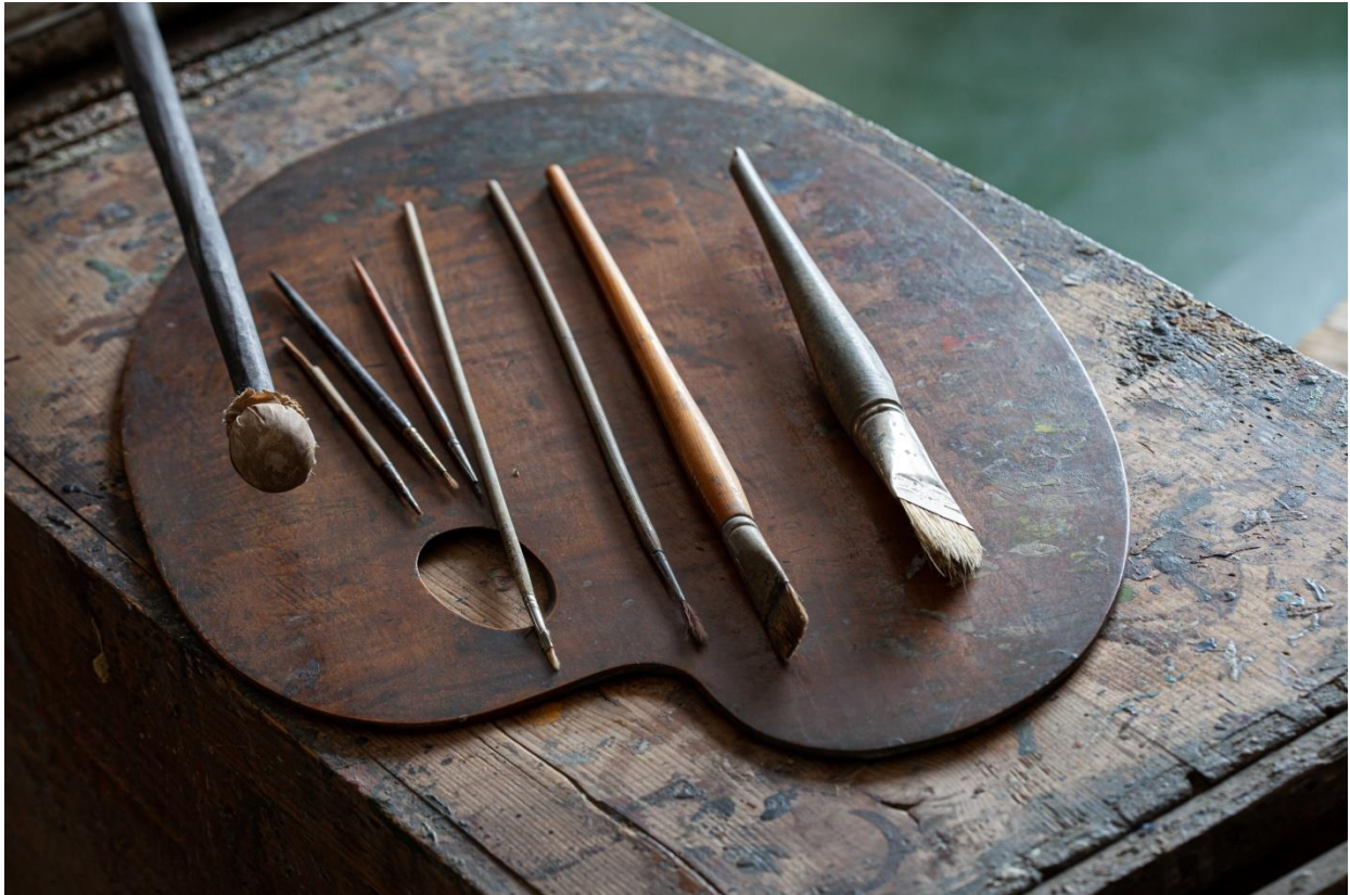
Szőnyi István palettája, ecsetei és festőbotja

Szőnyi István Kossuth díjas festőművész 1924-től haláláig, 1960-ig élt és alkotott Zebegényben. F fiatal házasként jött ide, ahol sikeres pályakezdő festőből a 20. század egyik legnagyobb hazai művészevé és egyben Zebegény festőjévé vált. Itt születtek legjelentősebb alkotásai, melyek témái a falusi élet, a zebegényi táj, a Dunakanyar, illetve családja és otthona voltak. A ház 1967 óta emlékmúzeum. Az eredeti bútorokkal, festményekkel berendezett szobák, amelyet Szőnyi több enteriőr képén is megörökített, felidéznek annak a kornak a hangulatát, amikor a festő még itt lakott. Műtermeiben érintetlenül sorakoznak a festőszerszámok, a festékek és közepén ott áll egykori festőállványa is.