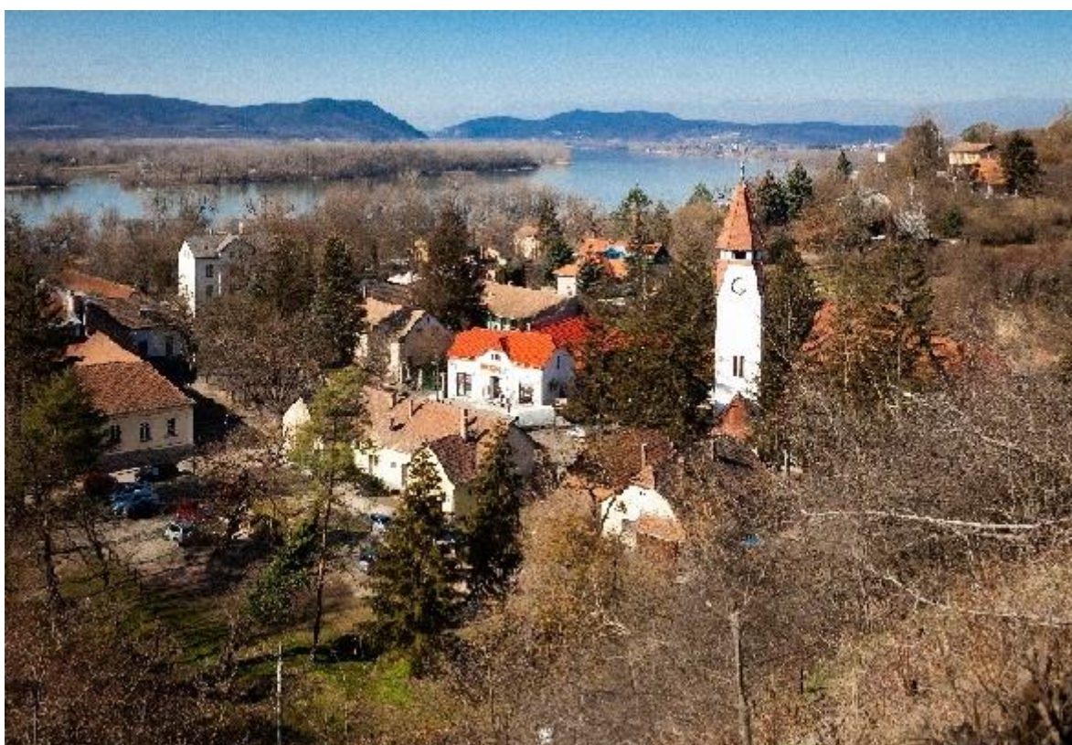
Templom látképe ma