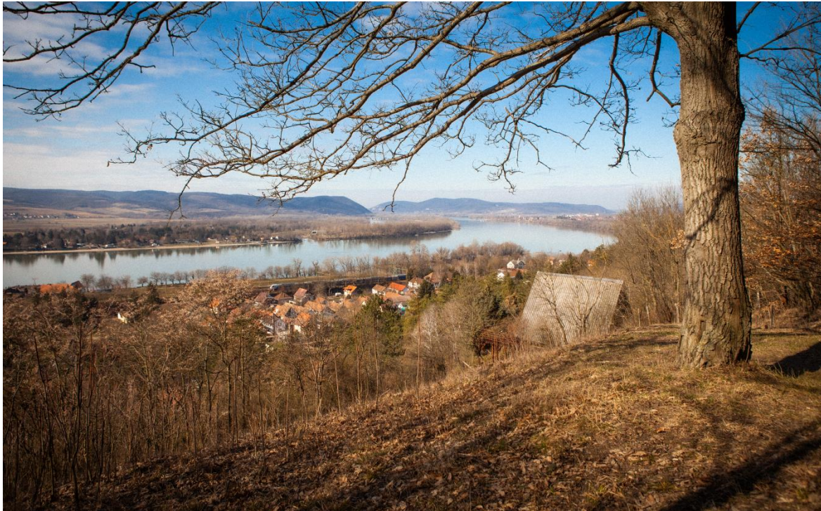
Látkép a Ferde-rétről

A temető feletti hegyoldalon lévő Ferde rétről csodálatos kilátás nyílik a Dunakanyarra. Szőnyi gyakran feljött ide, hogy tanulmányozza a megunhatatlan látványt, amelyet minden évszakban és napszakban, többféle technikával is megörökített. A Dunakanyar című alkotás még 1923-ban készült, az egyik első zebegényi látogatása alkalmával.