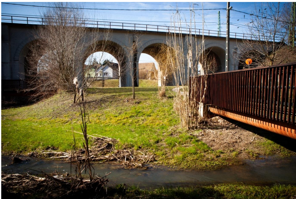
A hétlyukú híd ma