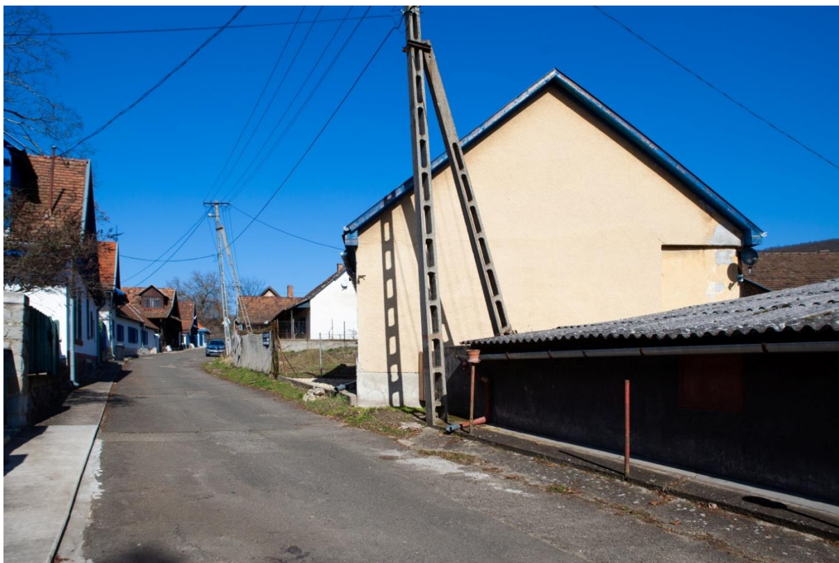
A Napraforgó utca ma