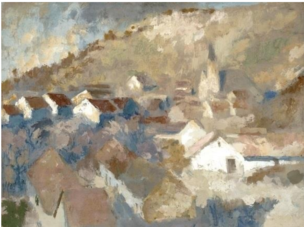
Falu ősszel, 1950