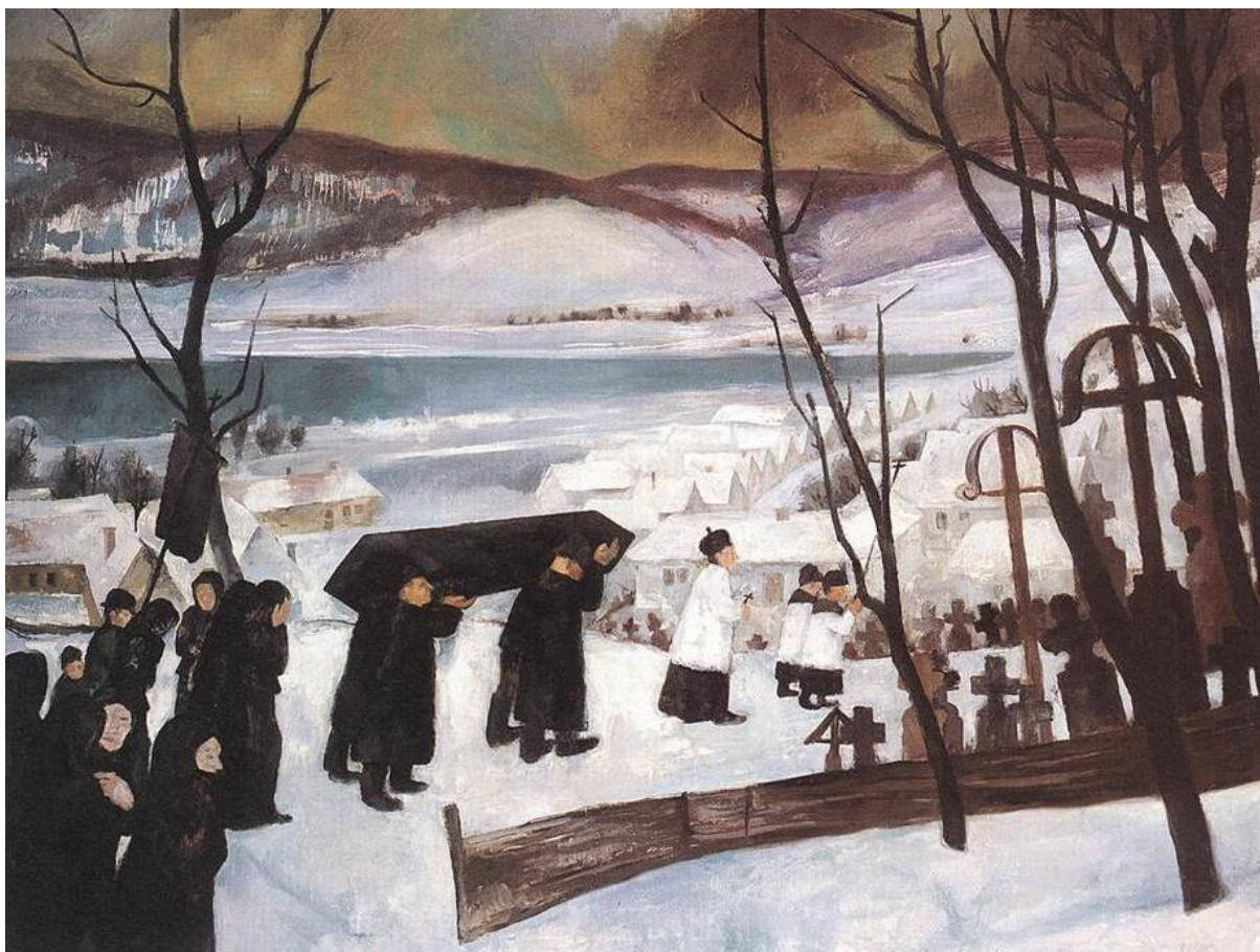
Zebegényi temetés, 1928