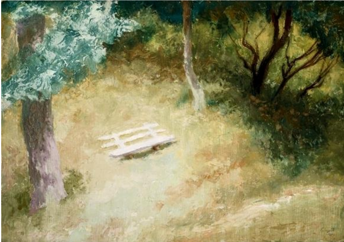
Kerti pad, 1943