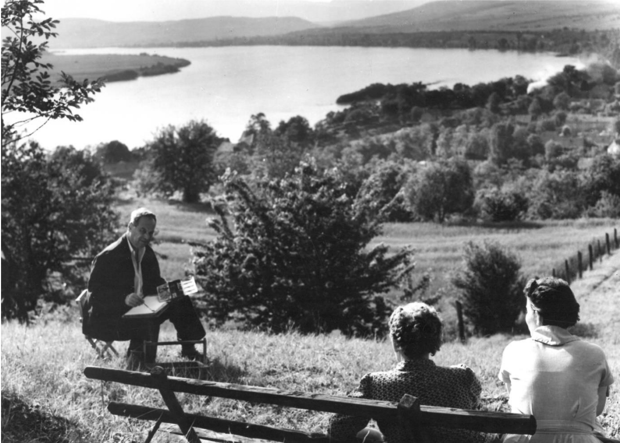
Szőnyi a kertben

A házhoz tartozó hatalmas kert egy szabadtéri műterem volt Szőnyi számára, napjai jó részét itt töltötte. Nemcsak a Dunakanyar és Zebegény látképét örökítette meg innen, más témákat is festett. Itt a kertben készült a Lány a kútnál című kép is, a kerek kút mellett. Az alkotási folyamat fázisairól és az egyedi festőtechnikáról dokumentumfilmet forgattak 1957-ben, amelynek végeztével az elkészült festményt a művész a film rendezőjének, Kollányi Ágostonnak adta. A Lány a kútnál vázlata a nagyműteremben, Szőnyi egykori festőállványán van kiállítva. Az ötholdas, dombra kúszó kertben Szőnyi idejében veteményes, gyümölcsös, legelő, dió és szelídgesztenye fák voltak. 1967 óta a kert nyaranta alkotótáboroknak ad otthont.